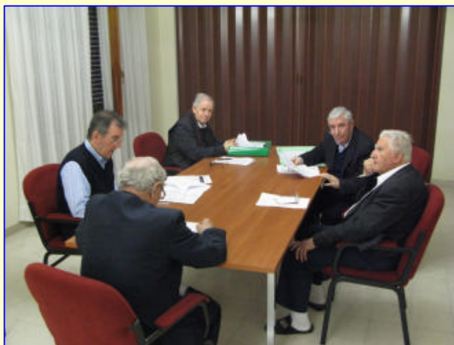
4. Commissione Integrazione dei Laici ↓