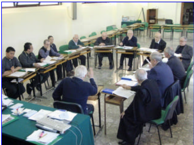
1. Commissione Vita Comunitaria e Vocazioni ↑