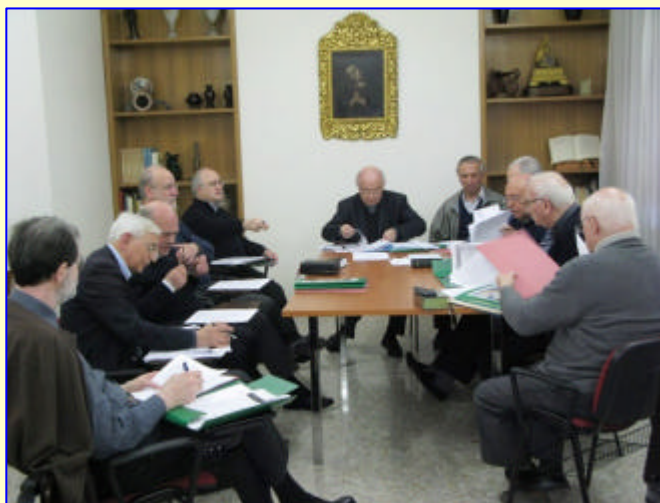
2. Commissione Scuola e Ministero ↓