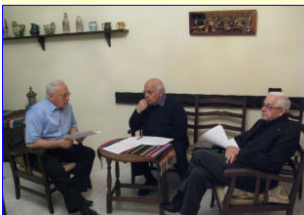
5. Commissione Economia ←