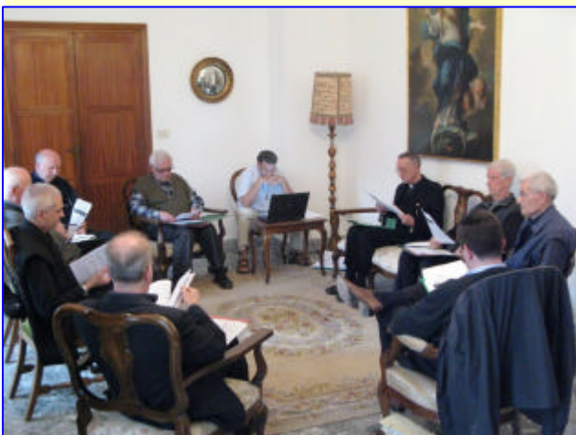
3. Commissione Parrocchie e Missione ↑